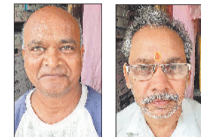
नगर के व्यवसायी।

नगर में विगत एक महीने में तीन आत्महत्या की घटनाएं हो गई हैं जिसे लेकर लोग चिंतित हैं। जिस प्रकार से परिवार का विच्छेदन, छोटी-छोटी बातों में लोगों का उग्र होना, मोबाइल की लत, आर्थिक स्थिति खराब होना, एकाकीपन लोगों को घेरते जा रहा है निश्चित रूप से यह आत्महत्या की ओर लोगों को अग्रेंथित कर रहा है। नगर में एक माह के अंदर एक नाबालिग बच्ची एवं दो युवक, युवती अलग-अलग कारणों आत्महत्या किए। नगर में दोबारा इस प्रकार की घटना न हो इसके लिए सभी लोगों को चिंता करने की आवश्यकता है आखिर में क्यों लोग आत्महत्या जैसे खौफनाक कदम उठा रहे हैं।