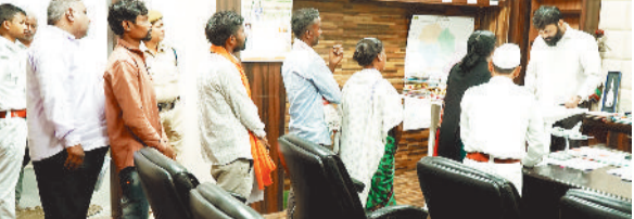
मुद्रालोन कार्यक्रम में उपस्थित महिलाएं।