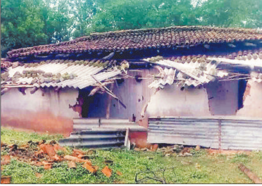
हाथियों द्वारा क्षतिग्रस्त घर।