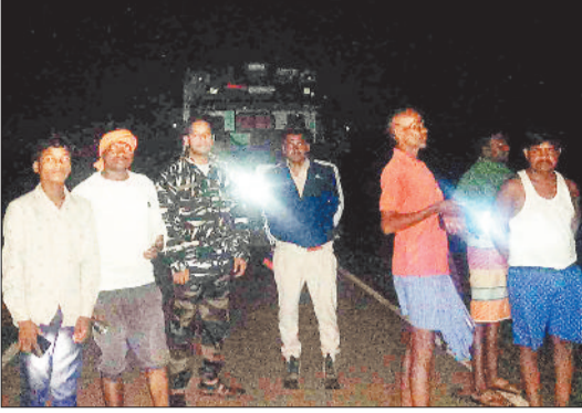
रात में हाथियों की निगरानी करते वनकर्मी एवं ग्रामीण।

मजबूर कर दिया है। हाथी मध्यरात्रि में आबादी क्षेत्र में पहुंचकर घरों में तोड़फोड़ मचा रहे हैं। विपरीत मौसम के कारण हाथियों की निगरानी में भी समस्या हो रही है। हाथी पलक झपकते ही अपना ठिकाना बदल दे रहे हैं जिससे परेशानी और अधिक बढ़ गई है। सीमावर्ती कापू जंगल लम्बे समय से भ्रमण कर रहा 13 हाथियों का दल पिछले एक सप्ताह से वन परिक्षेत्र मैनपाट के विभिन्न गांवों में लगातार तबाही मचा रहे हैं। भोर होते ही हाथी सीमावर्ती कापू जंगल में चले जाते हैं तथा शाम ढलने अलग-अलग स्थानों से पहाड़ी चढ़कर मैनपाट के विभिन्न गांवों में पहुंच जाते हैं। आबादी क्षेत्र के निकट के जंगलों में कुछ समय बिताने के बाद हाथी बस्तियों में पहुंचकर तोड़फोड़ मचना शुरू कर देते हैं। भोजन चक्र में बदलाव आने के कारण हाथी वनस्पतियों के साथ ही अब विभिन्न प्रकार की फसलों एवं अनाजों की खोज में भटकते हैं तथा गंध मिलते ही घरों को ढहाना शुरू कर देते हैं। हाथी अलग-अलग दलों में विभिन्न