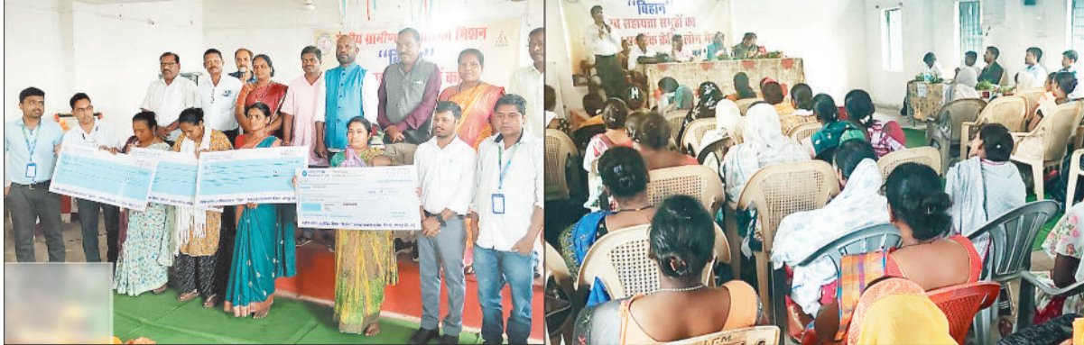
महिलाओं को मुद्रालोन का चेक प्रदान करते बैंक अधिकारी।